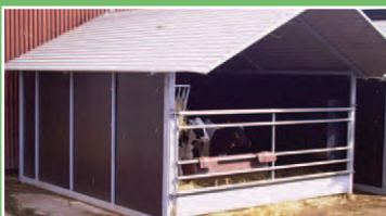
Gruppehytte I - 3x4,50 m

Raske dyr: .... en daglig glæde .... sparer tid og energi .... giver sunde tal på bundlinien