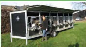
Kalveexpress - mobil - 6 bokse