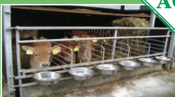
Forværk m/ adskillelse og skåle